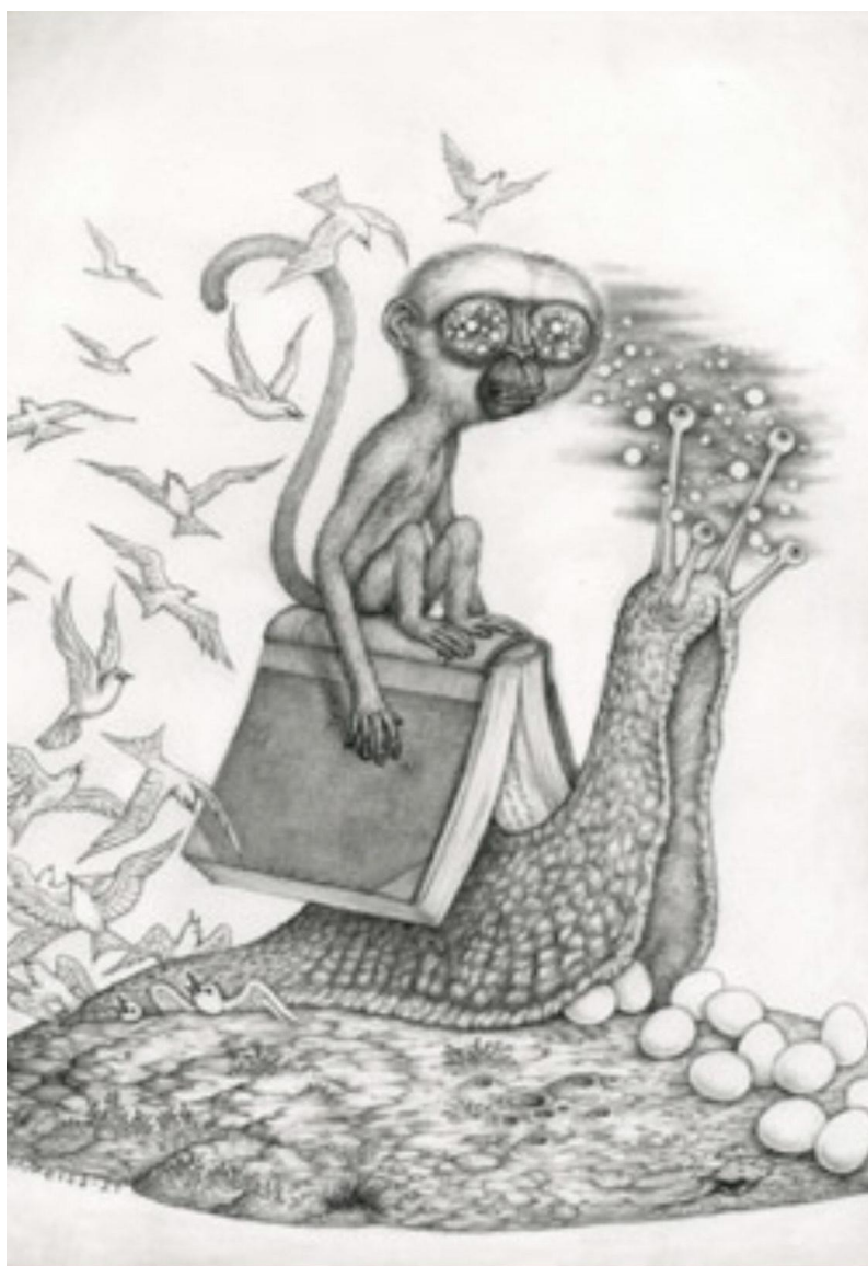
Illustration af Otto Dickmeiss

Hele herligheden...og meget mere til PLC