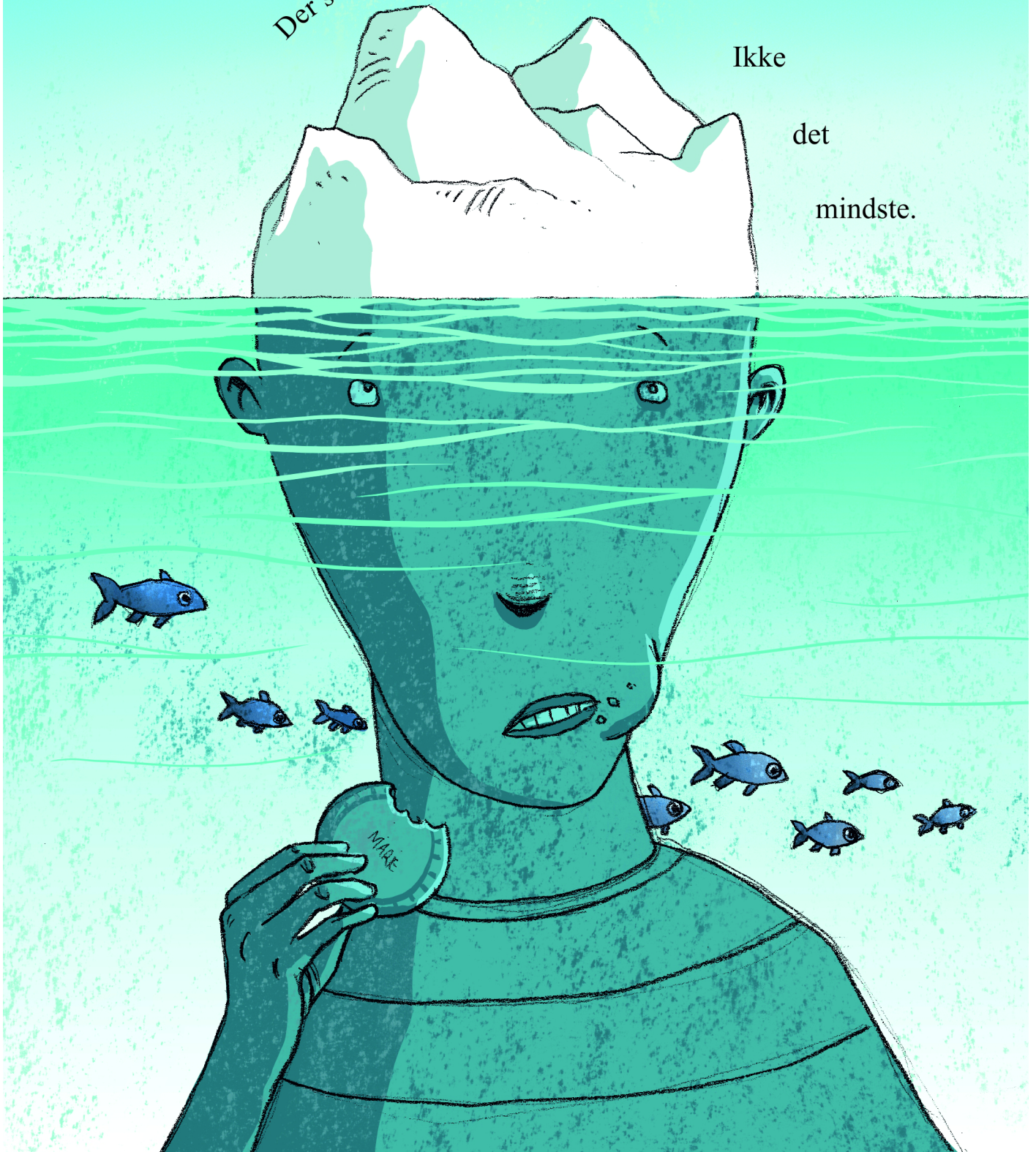
Illustration: Søren Jessen